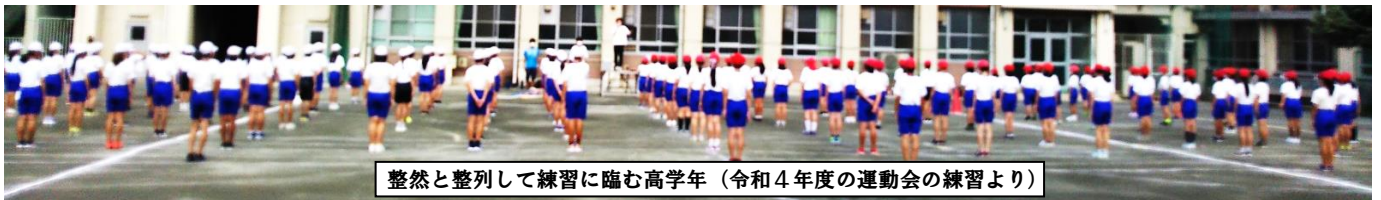
整然と整列して練習に臨む高学年（令和4年度の運動会の練習より）

今年度の運動会も、伝統を引き継ぎながら、子どもたちが活躍する有意義な運動となるよう検討しています。引き続き、ご支援、ご理解、ご協力いただきますようお願い申し上げます。