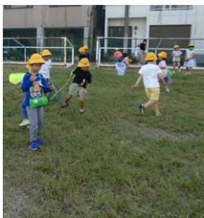
一年「むしさがし」サブグラウンド

今後も、保護者の皆様のご理解とご協力、そして、ご参加をいただくことを検討しながら、地域とふれあい、地域から学ぶ活動を実施していきたいと思ひます。