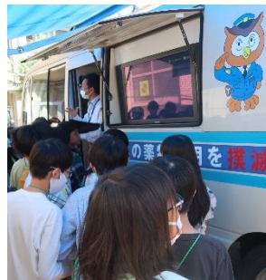
六年「薬物乱用防止教室」