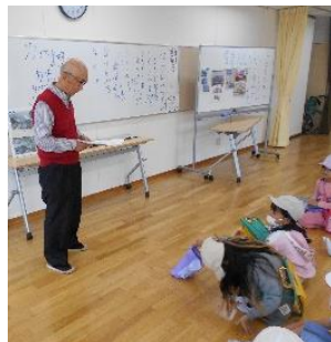
二年「学区探検」橘コミセン