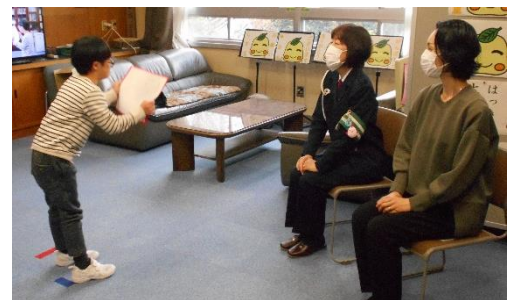
いつもありがとうございます!

3学期も、子どもたちの安全のため、皆様方のご理解、ご協力を何卒よろしくお願い申し上げます。