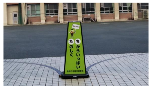
「あいさつの碑」が新しくなりました!