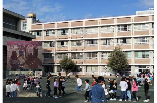
みんなで力を合わせて長縄を練習中!

学校の教育活動に対しまして、3学期も、引き続き、ご理解とご協力いただきますようお願い申し上げます。